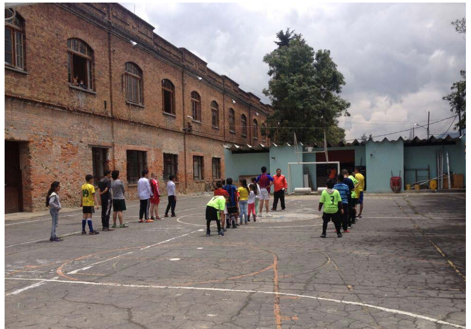
Figura 5. Proyecto de construcción social de espacio público. Localidad de Los Mártires, Bogotá (Colombia). Colectivo Amigos de la Estación. Estación de la Sabana

Es precisamente este el fundamento del urbanismo participativo, la gestión del territorio a través del activismo social. Así pues, después de