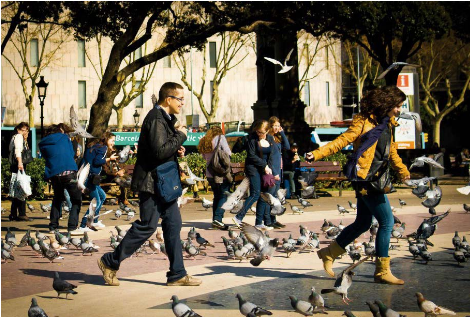
Figura 4. Representación de los actores principales de la ciudad. Ciudadano, medio ambiente, territorio. Espacio colectivo y participativo. Plaza Cataluña, Barcelona (España)

Por último, el principio de recursividad viene siendo el más significativo para este trabajo, sin dejar a un lado la relevancia de los otros dos, dado que en este se afirma que: