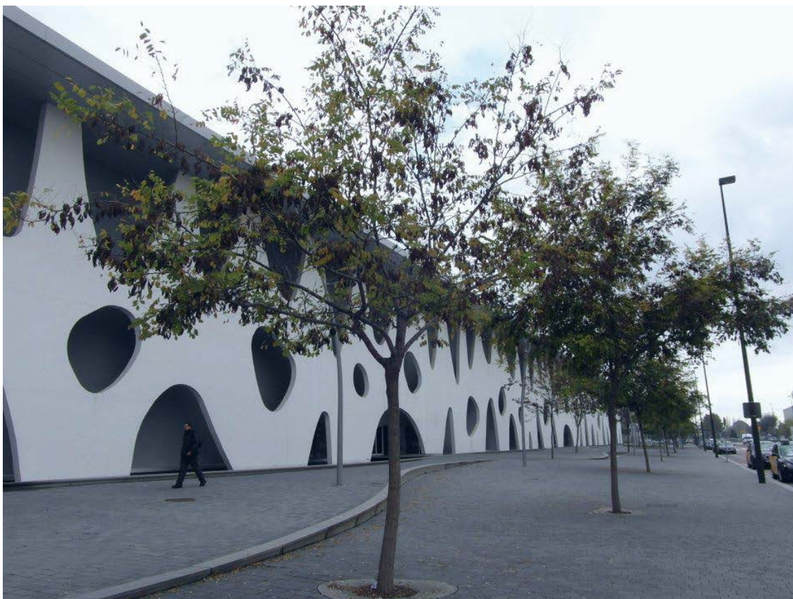
◀ Figura 1. Paisaje urbano. Componentes de la ciudad – Inserción dentro del espacio natural – Relación directa con el ciudadano. Plaza de Europa, Hospitalet de Llobregat, provincia de Barcelona.

La ciudad como escenario de asentamientos humanos tiene una historia de casi diez mil años, donde el proceso de evolución y cambio de la misma están marcados por los acontecimientos políticos, económicos y sociales de cada época, acontecimientos que afectan no solo al ciudadano que la habita, sino, además, su dinámica y sus condiciones espaciales. Se ha planteado, al menos desde la teoría, que la transformación de los espacios urbanos debe hacerse de acuerdo con las necesidades que el ciudadano ha presentado según dichos acontecimientos. Es entonces donde se entra a analizar si, en nuestros días, el contexto de ciudad responde a las verdaderas necesidades de sus habitantes, si lo vincula en su procesos de desarrollo, y cuáles serían las nuevas alternativas para lograr que la ciudad sea el escenario que responda a los requerimientos de calidad de vida que todos necesitamos.