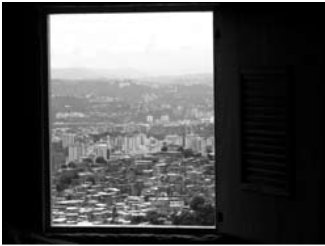
Escala que representa el interior de la vivienda, buscando siempre la integración con el exterior que representa la ciudad de Caracas y parte del Barrio de Petare Norte.