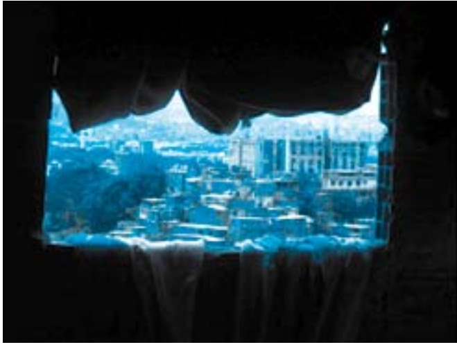
La Ciudad de Caracas desde una ventana de vivienda informal en "Petare Norte".