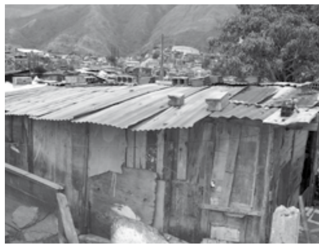
Escala que representa la vivienda desde el exterior.

Sin embargo, las crecientes desigualdades en el territorio, la división cada vez más manifiesta entre incluidos y excluidos , pueden dar lugar a una lucha de clases en el territorio o a una conflictividad asimétrica de difícil gestión en la fragmentada democracia local. La agudización de los conflictos entre colectivos sociales segregados puede desembocar en el fascismo urbano que recientemente anunciaba Sassen. La autora de la ciudad global advierte que en muchas ciudades la rebelión social que tenderá a expresarse en las periferias marginadas tendrá como probable respuesta un autoritarismo que acentuará la exclusión de las poblaciones pobres, inmigradas y de minorías diversas (2004).