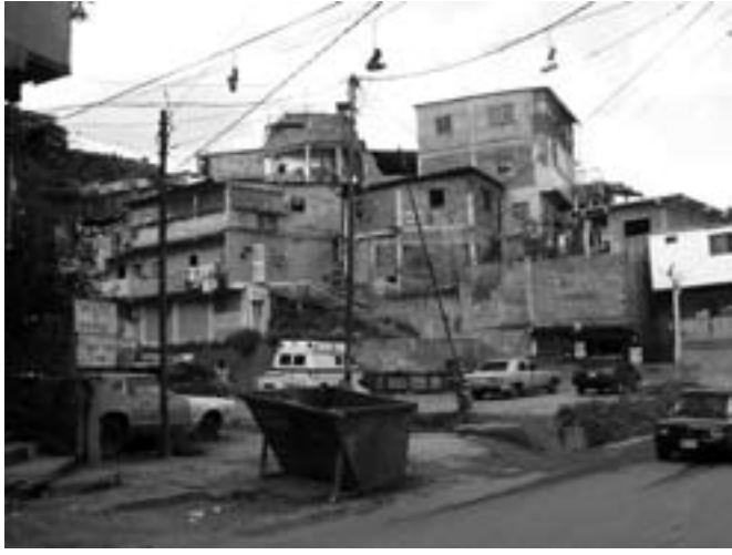
Consolidación de grandes asentamientos informales Caricuao en Caracas.