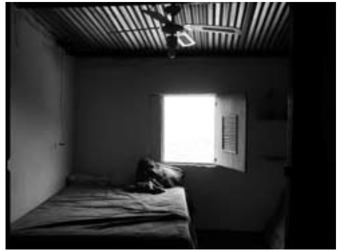
Escala que representa la vivienda desde el interior.