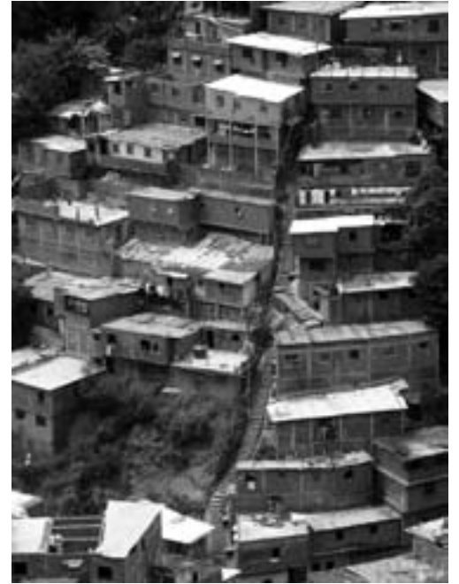
Consolidación de grandes asentamientos informales Petare Norte en Caracas.

los órganos de administración central, lo cual ha permitido la aparición de distorsiones –asentamientos informales.