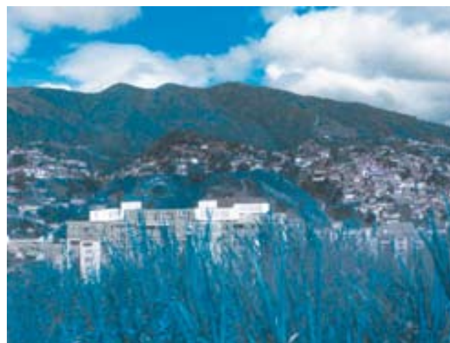
Consolidación de grandes asentamientos informales El Cementerio-Caricuao en Caracas.