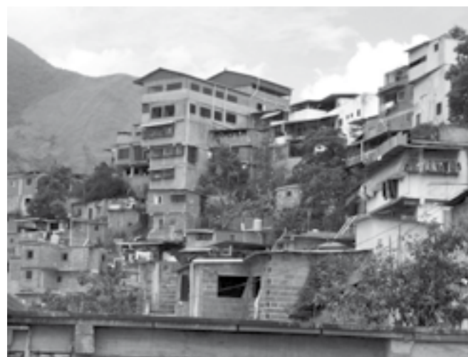
El desmesurado crecimiento del Barrio Petare Norte (7 pisos aproximadamente de altura, sin contar las viviendas que se encuentran en las partes bajas).

En este caso, la metodología utilizada se basó en la observación y la revisión de bibliografía, con el fin de reflexionar sobre las dificultades presentes en el contexto metropolitano. En este sentido, se establecen tres escalas: local-metrópolis-global. Lo anterior, con el propósito de precisar la ocupación del territorio venezolano, además, de sustentar las relaciones sociales que se incorporan en la participación de las comunidades o consejos comunales, como consecuencia del modo de concebir las políticas urbanas.