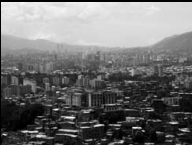
Nuevas interconexiones de los espacios físicos y funcionales.