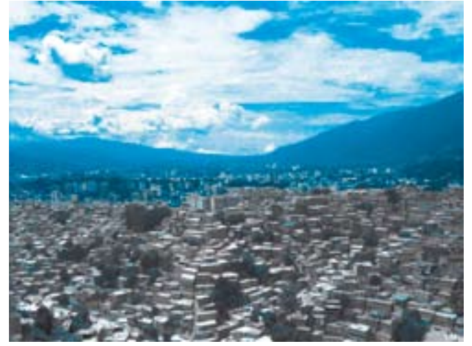
Escala que representa en parte la globalidad e hibridación que tienen lo informal con lo formal, conformando a la ciudad de Caracas.

En particular, la "nueva periferia" que se dio durante las décadas de 1980 y 1990 aparece como la "ciudad sin centro" que deriva de la interconexión física y funcional de los lugares y de los sistemas urbanos que conservan y potencian la propia identidad, porque ven en la misma un recurso que pueden hacer valer en la competición global. La imagen de las nuevas periferias es entonces compleja: en la escala macro aparece una única gran estructura difusora en forma de red, mientras que en la escala micro cada "nodo" de esta red revela caracteres específicos, identidades particulares y, por tanto, principios de organización espacial característicos de la misma. Los modelos generales aptos para describir estas nuevas realidades territoriales y sociales son precisamente aquellos de los sistemas complejos, de la autoorganización.