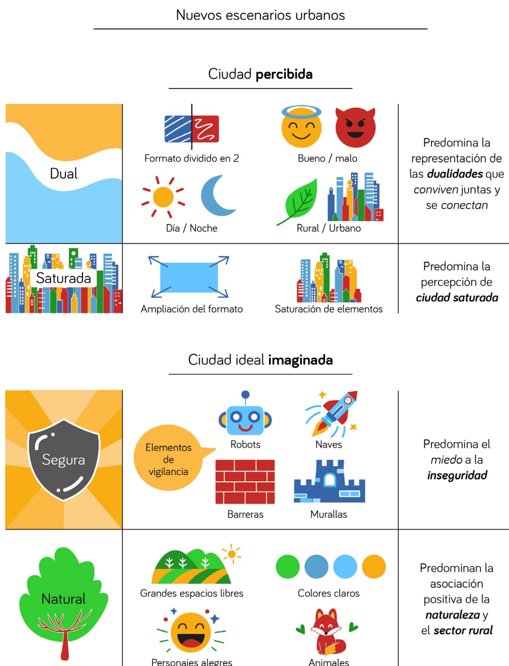
Figura 2. Diagrama de resumen de hallazgos

las composiciones evidenciaron el uso reiterado de dualidades como día/noche, campo/ciudad o bien/mal, generalmente representadas de forma simétrica, separadas por una línea divisoria. Sin embargo, en la mayoría de los casos, esas oposiciones se articularon por medio de caminos, medios de transporte o estructuras simbólicas que favorecían la conexión entre ambos mundos. Algunos grupos incluso desbordaron los formatos entregados, uniendo varios pliegos para ampliar el espacio de representación, lo cual puede interpretarse como una alusión al crecimiento urbano o la expansión de su imaginación espacial. Una constante fue la saturación visual en las zonas urbanas, lo que sugiere una percepción infantil de la ciudad como un entorno abrumador por la densidad de estímulos y elementos construidos.