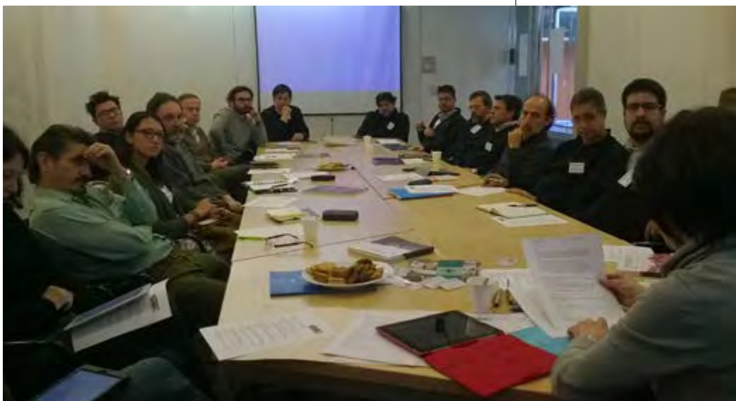
Figuras 1 y 2. Primer Encuentro de la Asociación de Revistas de Arquitectura Latinoamericana