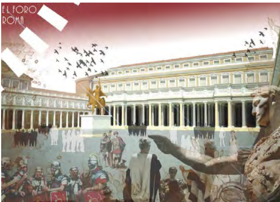
Figura 2. El foro - Roma

Se podría afirmar que el pensamiento de estos dos grandes filósofos se aproxima a una concepción ética de la polis donde las estructuras jurídicas, económicas, políticas y sociales deben ordenarse a generar cada vez mayores espacios para que sea posible la virtud ciudadana.