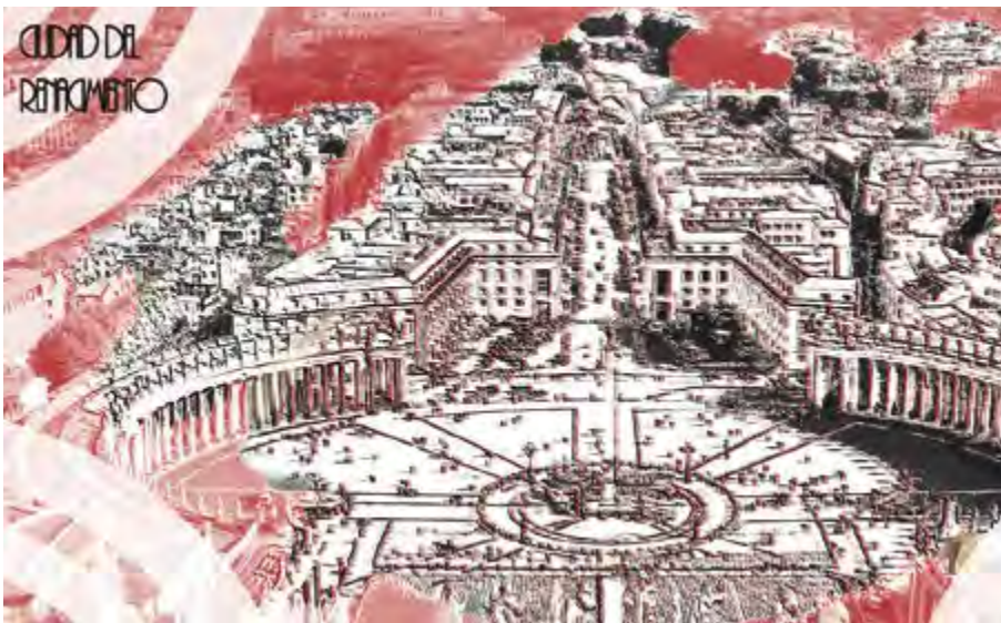
Figura 4. Ciudad del Renacimiento

La teorización de esa forma de autogobierno ciudadano arraigó en las ciudades-dinastía-Estado del Norte de Italia y generó un lenguaje político específico, el del humanismo cívico, cuya evolución hacia el republicanismo puede rastrearse en los siglos posteriores (Colom, s. f., p. 1).