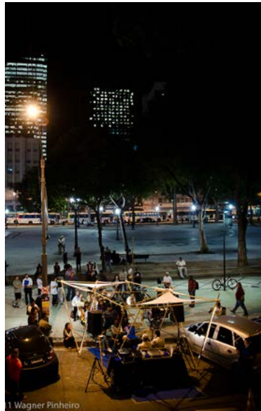
Figura 3. Debate na Vaga. Data: 16 de setembro de 2011. Lugar: Praça Tiradentes, Rio de Janeiro