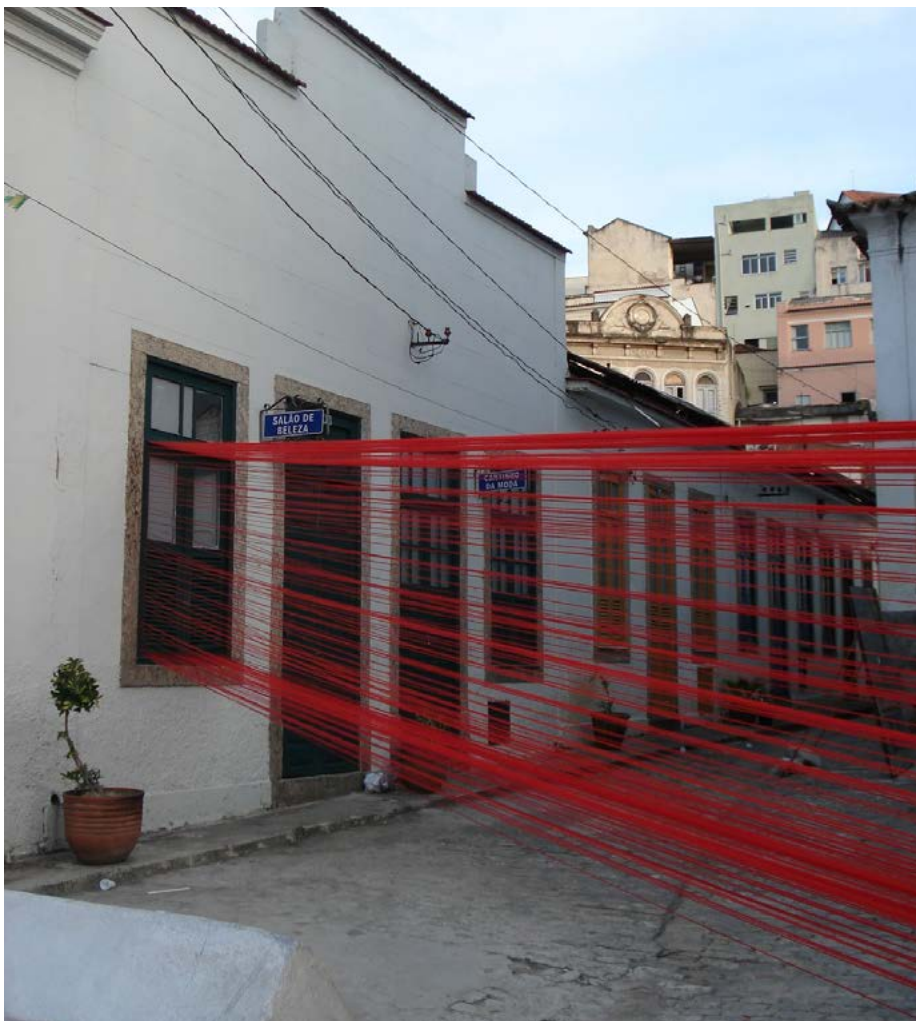
◀ Figura 13. Projeto Mauá. Data: dezembro de 2007. Lugar: Adro Igreja de São Francisco da Prainha, Morro da Conceição, Rio de Janeiro

Distintamente aos projetos de abertura dos ateliês, que estimulam a requalificação dos bairros, mas que operam em contextos de forte identidade