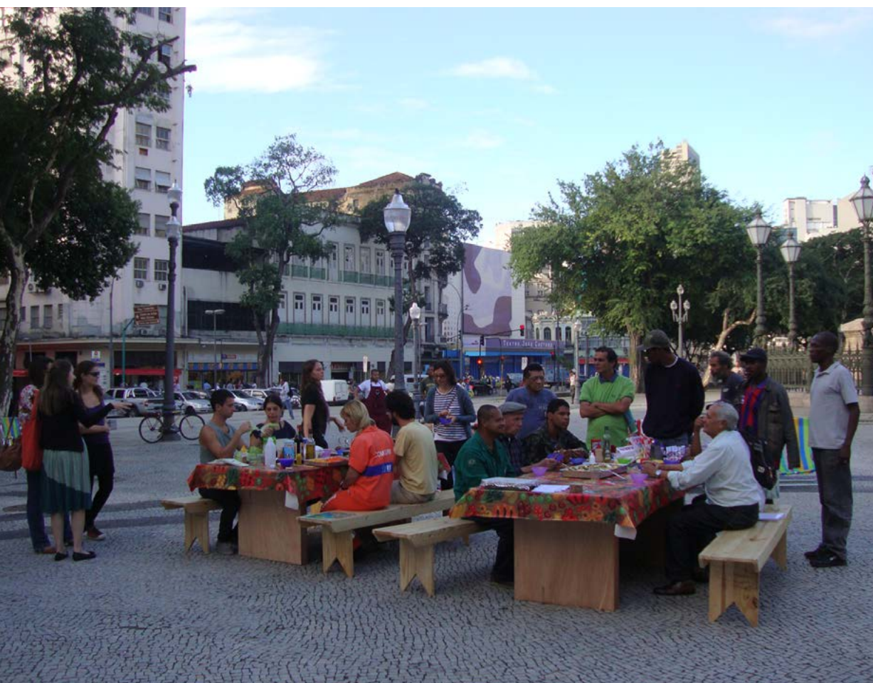
Figura 7. OPAVIVARÁ! ao vivo na Praça Tiradentes. Data: 19 de maio de 2012. Lugar: Praça Tiradentes, Rio de Janeiro

A intervenção “Chuvaverão” (OPAVIVARÁ!, 2014), realizada pelo mesmo coletivo OPAVIVARÁ!, consistiu em chuveiros públicos reais instalados na empena cega, voltados para o largo