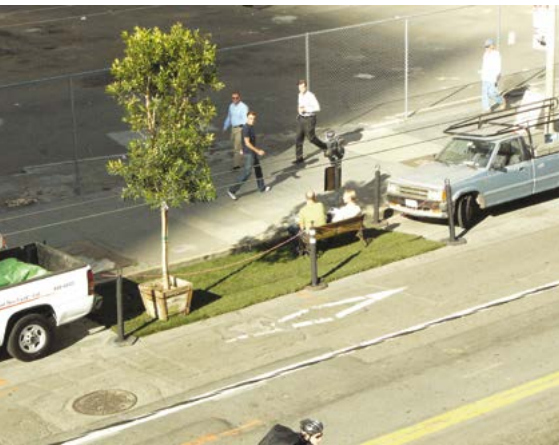
Figura 2. Park(ing) Day São Francisco. Data: 16 de novembro de 2005. Lugar: 1st and Mission Streets, San Francisco, CA