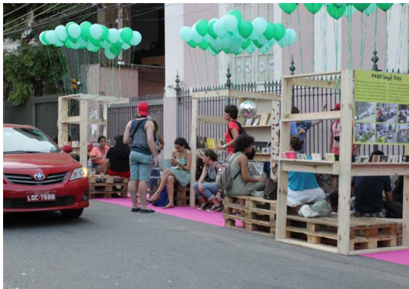
▲ Figura 6. Estação Árvore. Data: 18 de setembro de 2015. Lugar: Rua Esteves Júnior, Rio de Janeiro

“privatizado” (uma vaga de carro que poderia atender a somente uma pessoa em duas horas), convertendo-o em um espaço coletivo, subverteu o uso da rua por meio de uma gradação de usos que questionou os limites entre o público e o privado.