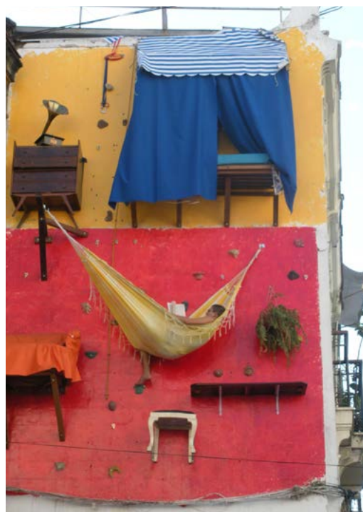
Figuras 8, 9 e 10. Chuvaverão, Cidade Dormitório e À Parede. Data: maio de 2014 / maio de 2007 / junho de 2009. Lugar: Galeria A Gentil Carioca, Centro, Rio de Janeiro