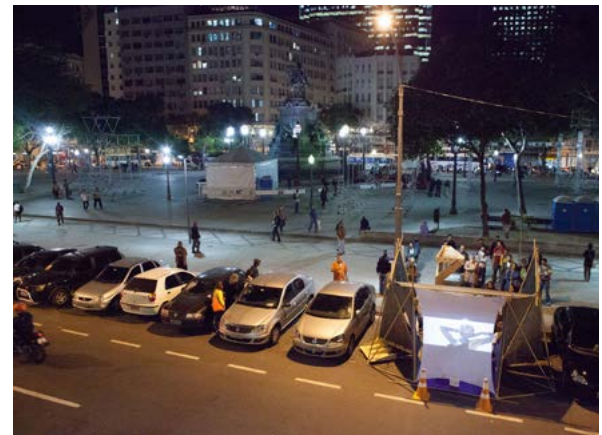
Figura 4. CineVaga. Data: 21 de setembro de 2012. Lugar: Praça Tiradentes, Rio de Janeiro

No segundo caso —espaços privados que adquirem utilização coletiva— a seleção baseou-se na busca pelas situações de “interior privado”, disponíveis na base de dados do site, situação em que fica clara a ideia da coletivização do suporte.