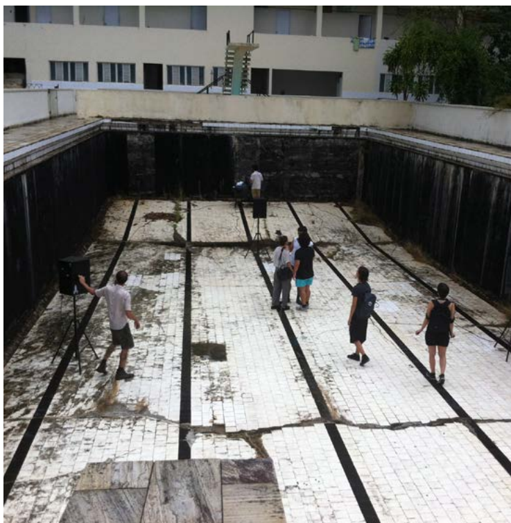
Figura 16. Piscina do Raposo. Data: janeiro de 2015. Lugar: Edifício Raposo Lopes, Santa Teresa, Rio de Janeiro

As intervenções analisadas potencializam os domínios dos pedestres, incentivando-os a andar à deriva, trocar experiências, conhecer lugares antes fechados, deslocar os usos dos espaços públicos convencionais e adentrar domínios particulares, criando espaços coletivos, ainda que efêmeros. Deslocando situações de cunho privado, doméstico ou íntimo, como o auditório, o cinema, as salas de jogos, leitura e estar, a pista de dança, a cozinha, o chuveiro e o dormitório para o espaço público; ou abrindo interiores privados para as deambulações artísticas e para a curiosidade do público, as intervenções temporárias tensionam o público e o privado e, confirmando nossa hipótese, espaços coletivos passam a surgir em espaços tradicionalmente entendidos como públicos e privados. Adicionalmente, elas motivam transformações de caráter mais duradouro: enquanto as intervenções mais antigas auxiliaram na revitalização de bairros e espaços públicos (eventos de aberturas de ateliês, Parede Gentil) e as intervenções frequentes vêm contribuindo para a elaboração de novas políticas públicas (Park(ing) Day), as mais recentes começam a se estabelecer e são promessas de novas transformações (Permanências e Destruições). Algo que há de comum entre todas elas é permitir que o efêmero passe a fazer parte da memória coletiva da cidade.