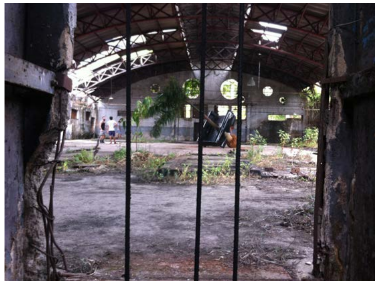
Figuras 14 e 15. Hotel Sete de Setembro e Estamparia Metalúrgica Victoria. Data: janeiro de 2015. Lugar: Flamengo e Benfca, Rio de Janeiro