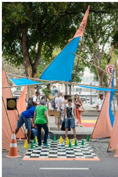
▲ Figura 5. Joga na Vaga! Data: 19 de setembro de 2014. Lugar: Praça Tiradentes, Rio de Janeiro