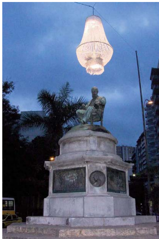
▼ Figura 12. Arte de Portas Abertas. Data: 4 de setembro de 2010. Lugar: Santa Teresa, Rio de Janeiro