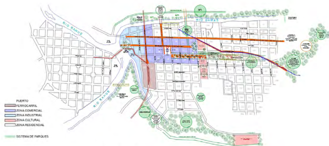
PLANO BASE: Plano Urbano N°2: Osorno en 1926.