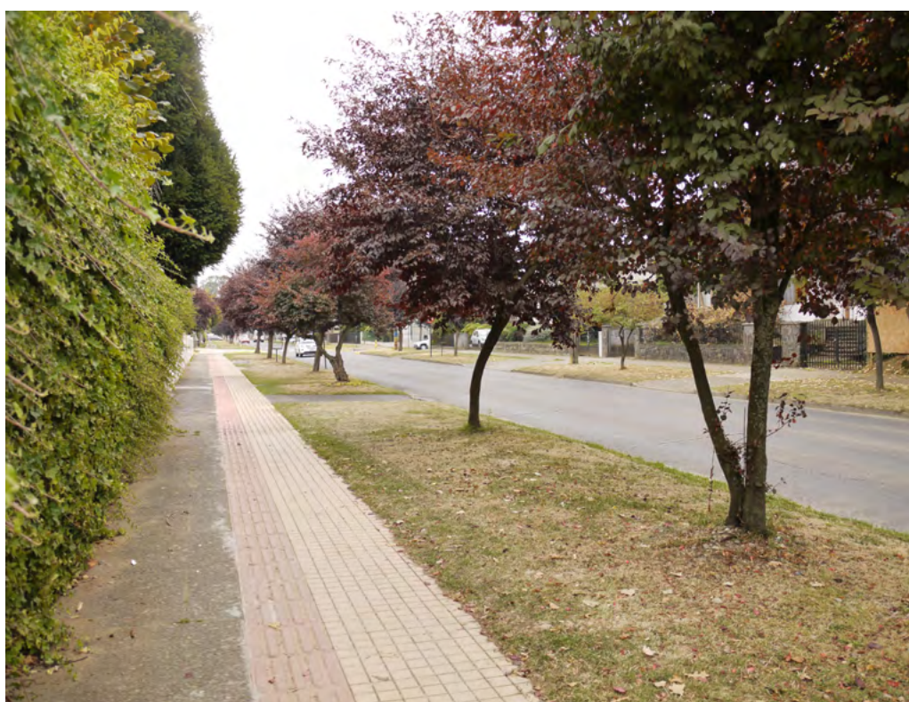
Figura 8. Paisajismo de una de las calles del sector sur poniente de Osorno. Arborización y fajas verdes.

Desde las relaciones entre espacio y sociedad, entre lo que se ha podido observar cobra relevancia el tono de “continuidad renovada” de la vía seleccionada por un grupo de habitantes de Osorno para llevar a cabo el proyecto modernizador urbano y arquitectónico, propuesta que, dada su particular forma, la cual acudió a conceptualizaciones no rupturistas ( civic art en urbanismo y traditionalismus en arquitectura ), ayudó a la idea de mantener una ciudad que, al modernizarse, también permanecía ligada a cierta herencia histórica en relación con su territorio sociocultural. Es posible decir que las transformaciones de modernización del espacio urbano de Osorno han sido no solo una producción de obra física, cuyas huellas se encuentran aún presentes, sino también, una producción de ideas y relaciones (Hiernaux, 1978, p. 119) que han sustentado