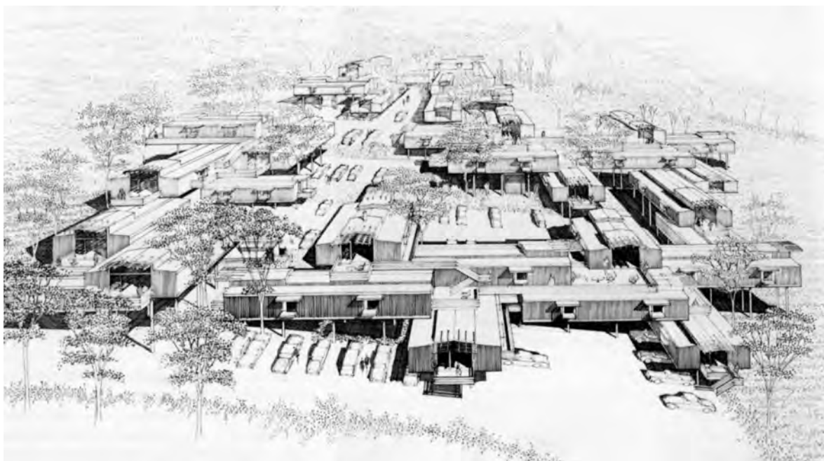
← Figura 4. La realidad compleja de la vivienda móvil. Paul Rudolph, "Magnolia Mobile Home Units"

Fuente: Scully (1988, p. 15) © Copyright Paul Rudolph.