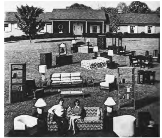
Figura 1b. La misma utopía, recuperada de un anuncio publicitario

Uno de los aspectos acometidos en esta investigación fue el papel que la reflexión en torno al modo de habitar y a la formalización de la vivienda tuvieron no solo en el debate arquitectónico del periodo de posguerra, sino también