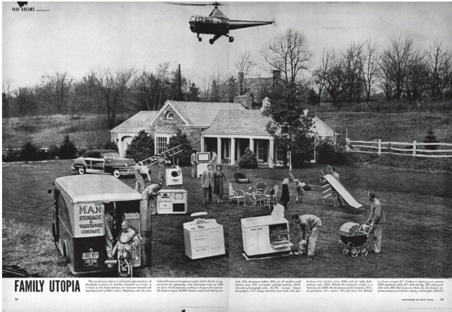
Figura 1a. La “utopía familiar” de posguerra, mostrada en las páginas interiores de la revista LIFE