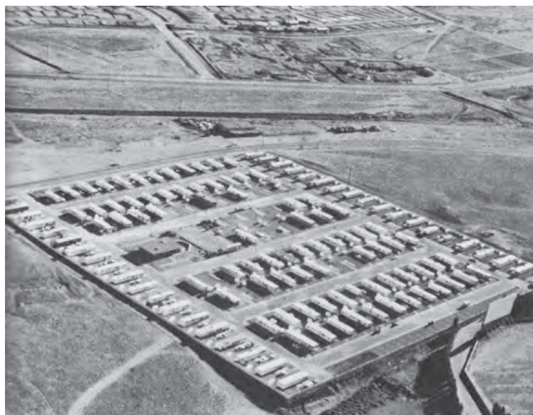
Figura 2a. Levittown, la quintaesencia de la estandarización e industrialización de la vivienda